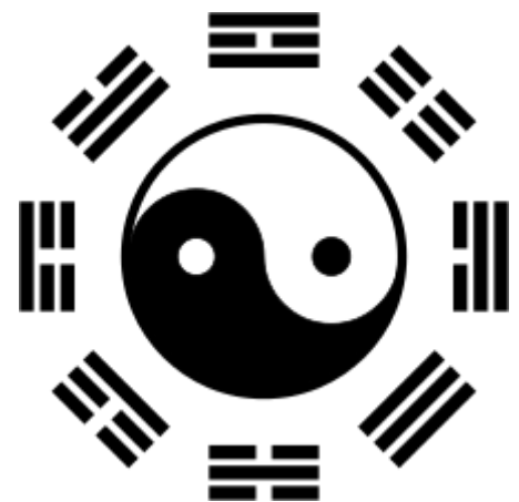
Le ba gua (ou pa kua) est utilisé pour positionner chaque élément dans la maison.

Le ba gua (pinyin : bā guà ) signifie les 8 guas 八卦 est un diagramme octogonal utilisé dans les analyses feng shui. Le sud est toujours placé en haut et le nord en bas. Cette disposition est en relation avec le champ magnétique terrestre. Chaque direction de l'octogone (nord, nord-est, etc.) possède des qualités particulières liées à la course du Yin 陰 et du Yang 陽.