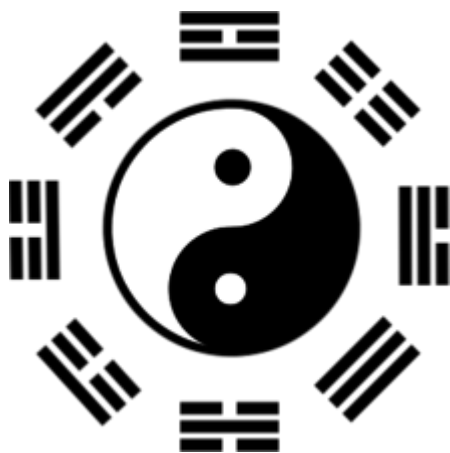
Le Ba Gua du ciel postérieur.

Le ba gua (pinyin : bā guà ) signifie les 8 guas 八卦 est un diagramme octogonal utilisé dans les analyses feng shui. Le sud est toujours placé en haut et le nord en bas. Cette disposition est en relation avec le champ magnétique terrestre. Chaque direction de l'octogone (nord, nord-est, etc.) possède des qualités particulières liées à la course du Yin 陰 et du Yang 陽.